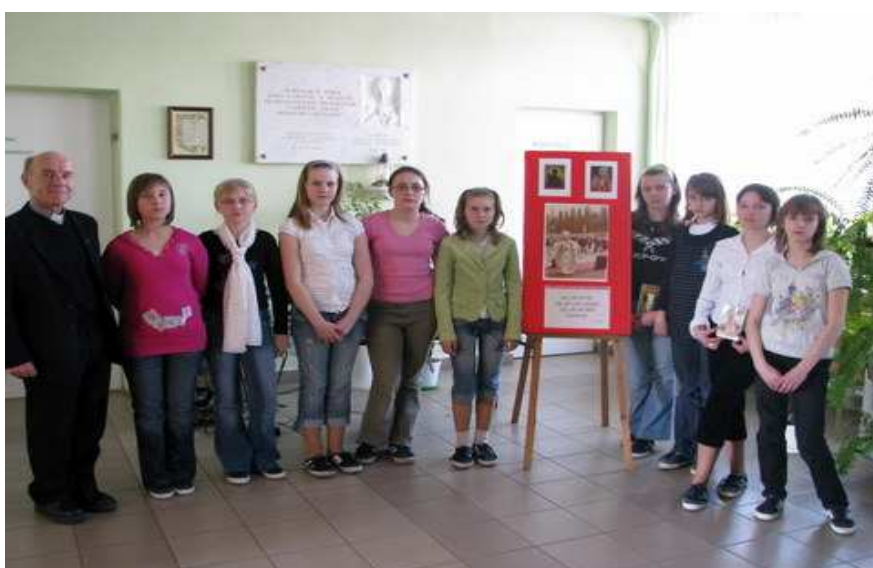
Uczniowie klasy VI wraz z księdzem proboszczem.