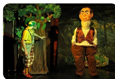
W krainie baśni braci Grimm str.5