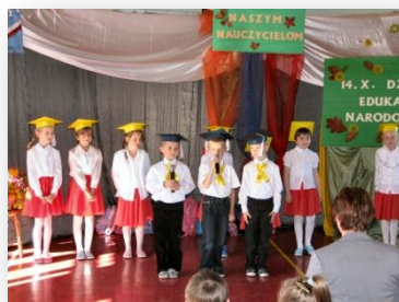
ŚLUBOWANIE PIERWSZAKÓW str.6