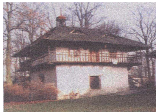
Zbór ariański w Ludyni